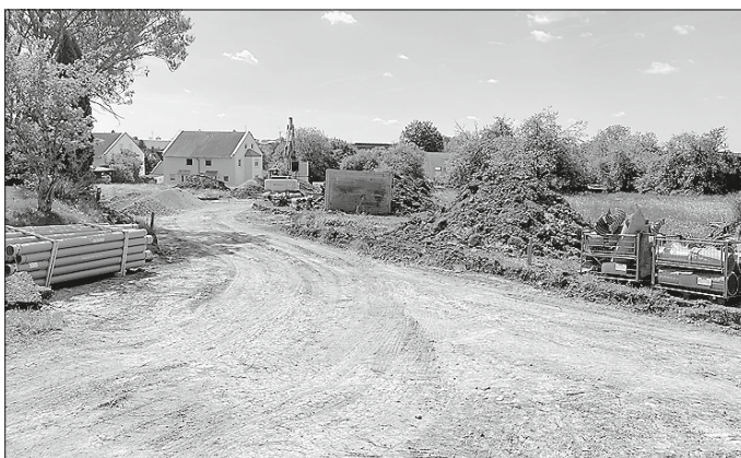
Die Firma Steinbrenner kommt bei den Tiefbauarbeiten auf der Lerchenhöhe gut voran.