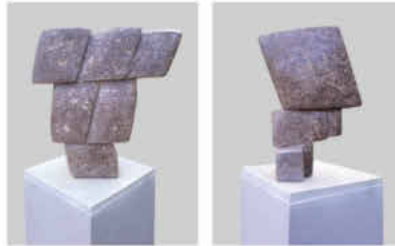
Quinte/2005 Muschelkalk 37 x 34 x 11 cm