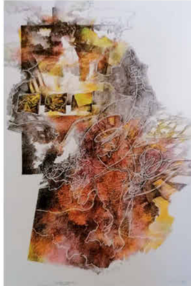
campo fugace/2017 Blei- und Farbstift 70 x 100 cm