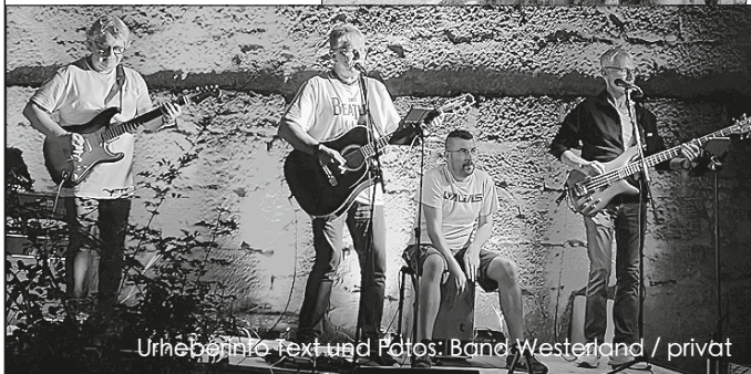
Urheberliche Text und Fotos: Band Westerland / privat