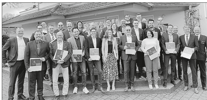
Die Vertreter der Städte und Gemeinden nahmen den Notfallplan entgegen.

Der Landkreis hat 2021 die Gefährdungsanalyse eines flächen-deckenden Stromausfalls bei der Beratungsgesellschaft KomRe AG beauftragt. Aus den Ergebnissen dieser kritischen Infrastruktur-Analyse ergab sich der Bedarf für die Erstellung eines Sonder-schutzplans Blackout für den Landkreis und Notfallpläne für alle 30 Gemeinden, welche 2022 in Auftrag gegeben wurden. Im Rahmen der Bürgermeisterdienstbesprechung im März wurden die Notfallpläne nun an die Vertreter der kreisangehörigen Städte und Gemeinden übergeben. „Es freut mich sehr, dass die Städte und Gemeinden in unserem Landkreis nun die Notfall-pläne erhalten haben. Mit den Plänen leistet der Landkreis einen wichtigen Schritt zur Krisenvorsorge und sorgt für mehr Sicherheit in den Kommunen“, sagt Landrat Gerhard Bauer. „Eine gute Vorbereitung auf das Krisenszenario Blackout stellt uns bestmöglich auch auf andere mögliche Schadensereignisse mit einem Ausfall der Infrastruktur ein. Sie sichert die wichtige Kom-munikation im Krisenfall zwischen den Kommunen, der Bevölke-rung und dem Landkreis“, so Kreisbrandmeister Joachim Wagner.