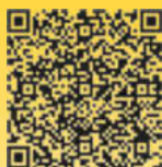
Christian, einer von uns.