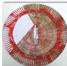
Sonja Streng: aus der Serie Spezies Rotkäppchen o.T. Mischtechnik auf Tortenkarton 2020

21120604LA. Eintritt frei. 11. Juli bis 22. August 2021 Hofratshaus Langenburg, Schloss 12 Ausstellungseröffnung Sonntag, 11. Juli 2021, 11:00 Uhr